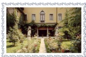
Palazzo Orgnani, Udine