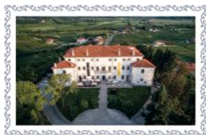
Villa Vipolze - Brda (SLO)