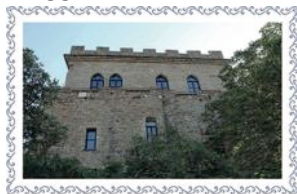
Castello di Muggia, Muggia - TS